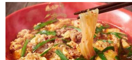
辛麺 税込 750円