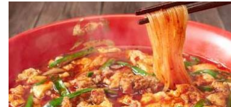
辛辛麺 税込 750円