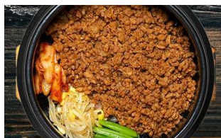
肉そぼろ丼 税込 750円