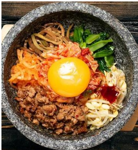
肉そぼろビビンバ 税込 650円