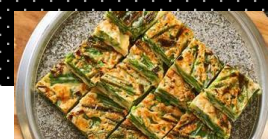
ニラチチミ 税込 400円