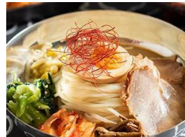
チャーシュー冷麺 税込 700円