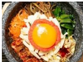
明太チーズビビンバ 税込 700円