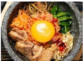
牛カルビビビンバ 税込 750円