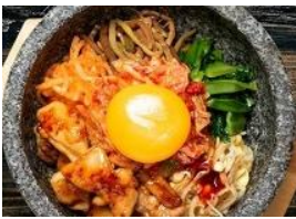
ダツカルビ ビビンバ 税込 700円