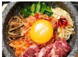
ハラミビビンバ 税込 750円