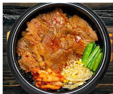
牛カルビ丼 税込 750円