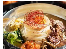
牛ハラミ焼肉冷麺 税込 800円