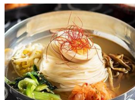
パラム風冷麺 税込 650円