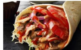
ケバトルティーヤ (やみつきビーフ) 6インチ 税込 450円 11インチ 税込 750円