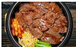
牛ハラミ丼 税込 800円