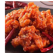
ヤンニャムチキン 税込 650円