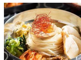
蒸し鶏冷麺 税込 700円