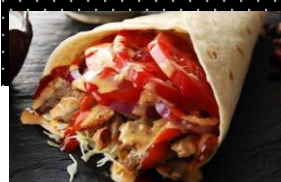
ケバトルティーヤ (ヘルシーチキン) 6インチ 税込 450円 11インチ 税込 750円